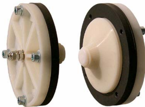
AFE - Externe montage