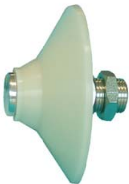
AFI - Montage in de silo