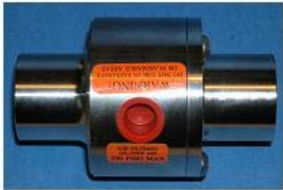
1 1/2" RVS 303 HD-Inline