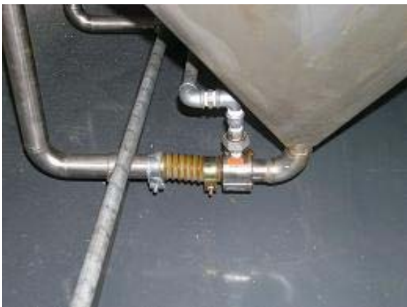
Transport van plastic granulaat